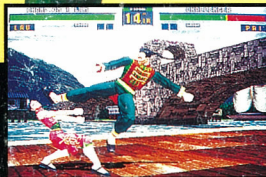
PS-X VIRTUA FIGHTER II