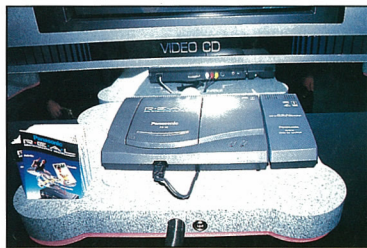
L'extension Video CD est l'appareil collé sur le côté droit de la nouvelle FZ-10 de Panasonic.

Cela est rendu possible grâce à une norme de compression, appelée MPEG (Motion Picture Expert Group), qui comprime les données animées. Seul problème: on en est à la génération supérieure, le MPEG-2, et Sony et Philips viennent d'annoncer une nouvelle norme pour le Vidéo CD. Conséquence directe: le standard actuel est condamné! Bien essayé, Goldstar!