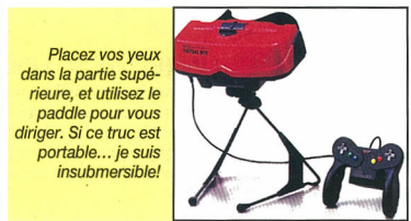
Placez vos yeux dans la partie supérieure, et utilisez le padle pour vous diriger. Si ce truc est portable... je suis insubmersible!

La Virtua Boy, pas inintéressante par quelques-uns de ses aspects, ne comble cependant pas nos attentes d'un produit un peu plus ambitieux de la part de Nintendo!