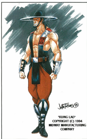
'KUNG LAO' COPYRIGHT (C) 1994 MIDWAY MANUFACTURING COMPANY