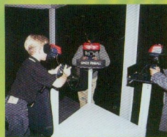
●眼鏡の奥には、何かがある? 甘くて酸っぱい立体映像が...