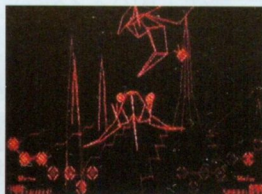
■ディーアンドイソフトが制作しているシューティングゲーム「レッドアラーム(仮題)」。ワイヤーフレームの立体感が、バーチャルボーイでさらに活きる!!