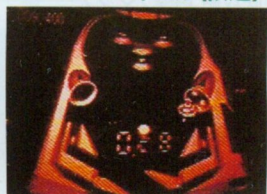
■任天堂が制作している「スペースピンボール(仮題)」。ボールが上のほうに上ぼけてくるなんていう、バーチャルボーイならではの要素が加わっているのだ。