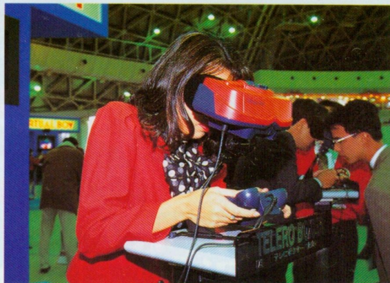
現在までに発表されているバーチャルボーイ用ソフト

さて、本体の値段と発売日が決まったとなれば、気になるのは同時に発売されるソフトのタイトル。残念ながら、まだ正式なリリースは出ていないんだけど、任天堂によれば4タイトル程度を予定しているということだぞ。初年度(発売から1年のあいだ)に300万台の販売を目指しているという、バーチャルボーイ。ニューマシン戦線の風雲児となれるか!? *