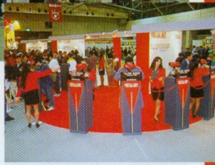
◆ニューハードダービーの大穴(?)バーチャルボーイも大人気。実際に見ないと実体をつかみにくいマシンだけに盛況もうなずける?