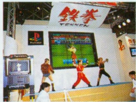
◆当日、発売直前だったナムコの「鉄拳」も、コスプレやゲーム大会といったイベントで大いに盛り上がっていたのだ。

なーんだ、ちょっと残念。でも、ヨーロッパでのプレイステーションの普及率がガンガン上がって現地生産されるようになれば、王室御用達になる可能性があるってことなのかも? *