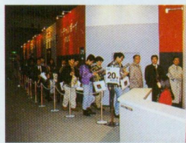
◆「バーチャルボーイやりたい!!」というわけで、このような行列。さてさて驚異の3D映像はどのように映ったかな?