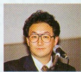
◆「セビウス」の速藤氏は若い人向けの話を中心に。