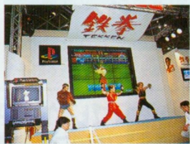
◆当日、発売直前だったナムコの「鉄拳」も、コスプレやゲーム大会といったイベントで大いに盛り上がっていたのだ。

なーんだ、ちょっと残念。でも、ヨーロッパでのプレイステーションの普及率がガンガン上がって現地生産されるようになれば、王室御用達になる可能性があるってことなのかも? *