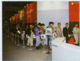
◆「バーチャルボーイやりたい!!」というわけで、このような行列。さてさて驚異の3D映像はどのように映ったかな?