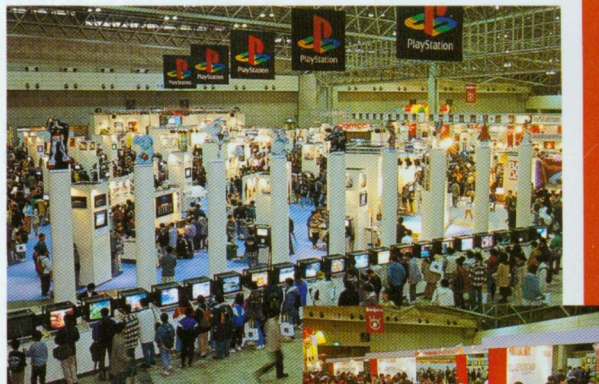
◆広い広い会場の、手前半分を占めるのはプレイステーション関連のブース。さすがは「いくぜ、100万台!」の勢いってどこか?

りだったのだ。 また、会場で圧倒的なスペースを占めていたのがプレイステーションのソフト。その展示スペースは全体のほぼ半分に及び、すでに発売されている人気ソフトから、今後の超目玉ソフトまで、まさに一堂に会したって感じだったのだ。 そのほか、各ブースごとにミニイベントが開かれたりもしたぞ。ちょっとしたゲーム大会から、ファンが集いのようなものまで、それぞれのソフトにふさわしいものが行なわれていたのだ。