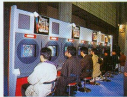
◆ソニー・コンピュータ・エンタテインメントの「VICTORY ZONE」は、まるで本物のパチンコ気分が楽しめたのだ。