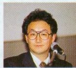
◆「ゼビウス」の速原氏は若い人向けの話を中心に。