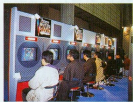
◆ソニー・コンピュータ・エンタテインメントの「VICTORY ZONE」は、まるで本物のパチンコ気分が楽しめたのだ。