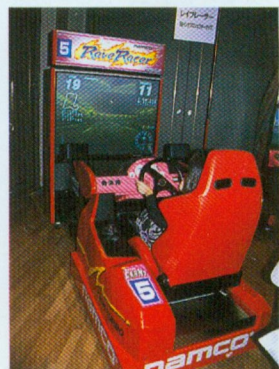
『レイブレーサー』のプロジェクトタイプ。カーブ時ハンドルに負荷がかかる装置付きだ。

これが『レイブレーサー』だ。シティーとマウンテンエキスパートという新しいコースが加わっている。通信対戦機能も持っているぞ。