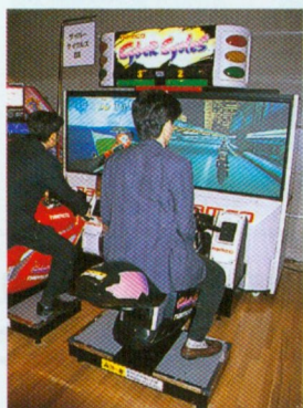
通信機能搭載のバイクレースゲーム『サイバースイクルズ』も登場。これはSDタイプ。

このふたつのソフトがイコールなのかということには、ナムコサイドはノーコメント。ま、どちらにせよレースゲームファンは、バリバリ遊んでおくべきか!?