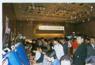
関係者向けの展示会だったんだけど、会場はこんなにも大盛況となったのだ。