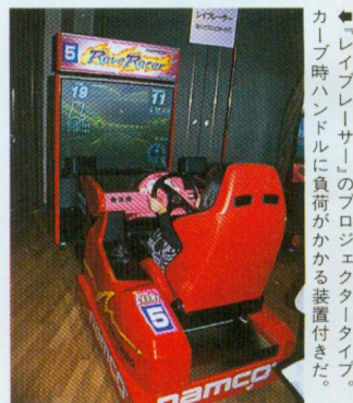
『レイブレーサー』のプロジェクタータイプ。カーブ時ハンドルに負荷がかかる装置付きだ。