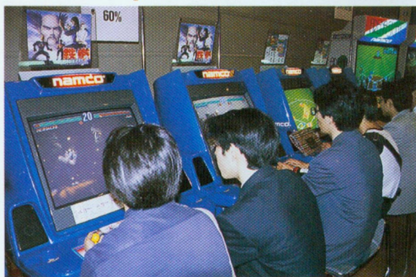
こちらは『鉄拳2』コーナー。まだ開発進行度60パーセント程度とはいえ、見事な動きをみせていたのだ。早く完成したバージョンで遊びたい!!