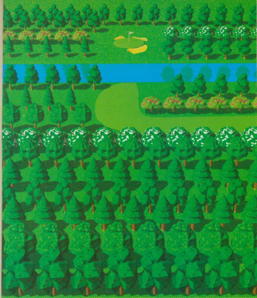
● ● ステレオグラムにトライして見よう!