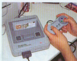
●やはりまくつても平気さ。お母さんも安心だ。

たとえば、消費電力8Wのスーパーファミコンを1日(24時間)フルに使うと、電気使用料金は4円前後。1ヵ月で約137円。1年だと約1648円ってところ。意外と安い。ちなみにネオジオも同じ使用料金のなかではいちばん安い。逆に使用料金が安いのは、ネオジオCD。1日で17円前後だ。