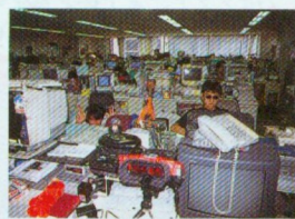
※答えは104ページにあります。

テーブル型の筐体で、お姉ちゃんがゲームをすると、まれに脚が大股開きになるという優れもの。各自治体で率先して導入し、喫茶店やゲームセンターに限らず、全国に設置してもらいたいものである。 ● ICBM ハードだったりソフトだったりする