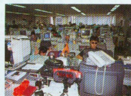
※答えは104ページにあります。

テーブル型の筐体で、お姉ちゃんがゲームをすると、まれに脚が大股開きになるという優れもの。各自治体で率先して導入し、喫茶店やゲームセンターに限らず、全国に設置してもらいたいものである。 ● ICBM ハードだったりソフトだったりする