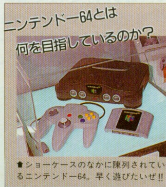
▲文中のニンテンドー64のゲームタイトルはすべて仮称です。

この日の講演にさきだち、山内社長はバーチャルボーイが低迷していることについて説明を行なった。そして、テレビゲームとの異質性を追求するバーチャルボーイらしいソフトを、来年の早い時期に発売すると発表した。つまり任天堂は、ニンテンドー64とバーチャルボーイ、ふたつのハードはまったく別々の方向性を持っていると考えているのである。ニンテンドー64は、スーパーファミ