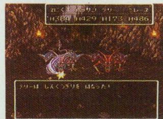
▲明日発売となる『ドラゴンクエストVI』。そして1年半後には、『ドラゴンクエスト64』(一たぶんウソ?)が遊べちゃうかもしれない。堀井さん、頑張ってください。