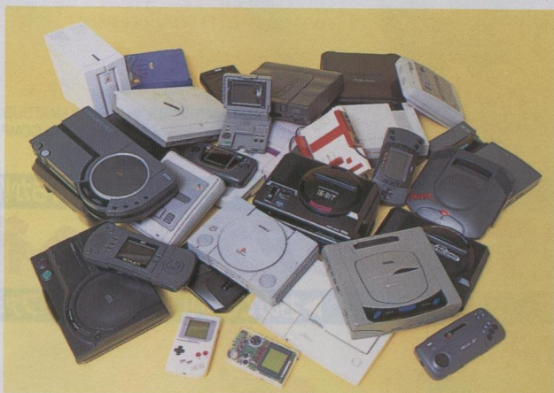
◆国内外のマシンを一堂に集めたぞ! これだけのマシンをそろえている人なんて……ひよっとして、いる?

これまで発表された数字から割り出した、編集部独自の予測値だ。また、サタンの累計出荷台数が、5月29日現在で300万台の大会を突破した、とセガが発表したぞ。昨年度、国内でいちばん出荷が多かったのは、何と言ってもスーパーファミコン。それをサターンとプレイステーションが追いつけている。その後をいくのがゲーム