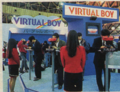
連日、バーチャルボーイの展示ブースは大盛況。来場者はひと足早く未体験ゲームを堪能