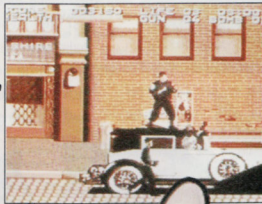
Timecop stammt von JVC, wird aber durch Virgin in Deutschland vertrieben