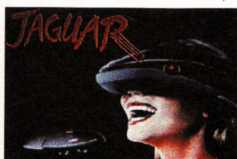
Werden schon jetzt mit Spannung erwartet: Der Saturn und Jaguars VR-Brille