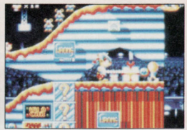
Oscar ist ein buntes Jump&Run aus dem französischen Softwarehaus Titus