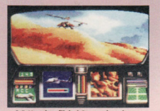
3-D-Voxelgrafik bei Comanche, einer actionreichen Hubschrauber-Simulation