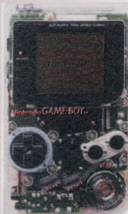
Nur in den Staaten zu haben: farbige und durchsichtige Game Boys

zige, den „Big N“ derzeit auf Lager hat, ist Wario's Woods , der März/April über die Bildschirme flackert (Tetris läßt grüßen). Auf dem Game Boy meldet sich Donkey Kong Land zurück. Donkey Kong Land besticht wie die 16-Bit-Fassung durch atemberaubende Grafik, wird vermutlich aber erst im Sommer hierzulande erscheinen. Ab