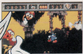
Izzy, das Olympia-Maskottchen in spielerischer Aktion