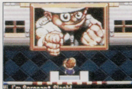
Big Sky Trooper – ein Rollenspiel für Anfänger und Fortgeschrittene

Emmit Smith hat's mit seinen Dallas Cowboys leider nicht zum Super-Bowl-Finale geschafft, trotzdem wird ihm viel Ehre zuteil: JVC bastelt fleißig an Emmit Smith Football (SNES), das nicht vor August zu haben sein wird. Bereits im April stellt Jean-Claude van Damme seine Kampfkunst in Timecop (SNES; wird von Virgin veröffentlicht) unter Beweis. Hal Barwood – „Vater“ des PC-Hits „Monkey Island“ – ist derzeit mit Big Sky Trooper beschäftigt, einem Rollenspiel für Anfänger und Fortgeschrittene. Noch nicht vom Fließband gerollt ist Rally – The Final Round of the World Rally Championship (SNES). Ob es jemals erscheinen wird, ist derzeit fraglich.