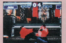
FX Fighter - Polygon-Prügelei fürs SNES mit Super-FX-2-Chip

Time (Rollenspiel, auch als Illusion of Gaia bekannt), Pac-Man 2 (ein Wiedersehen mit dem Ur-Vater der Spiele), Uniracers (superflinkes Einrad-Rennspiel, das bei uns Unirally heißen wird, echt originell) und Wario's Woods.