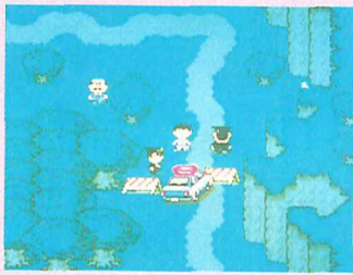
Earth Bound SN