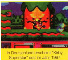
In Deutschland erscheint "Kirby Superstar" erst im Jahr 1997

re. Fortsetzungen erfolgreicher Serien dominierten, überraschende Neuentwicklungen gab's leider keine. Tatsache ist, daß die 16-Bit-er Ende 1996 endgültig abdanken, spätestens Weihnachten solltet Ihr dann eine Upgrade-Konsole im Visier haben.