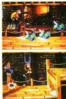
Neue Kullissen, bekannte Feinde: Dixie Kong bei der Arbeit.

Von anderen Firmen kommt nur noch vereinzelt Software: Capcom arbeitet am Superhelden-Beat'em-Up Marvel Super Heroes . Ocean wird nicht müde, ihre Render-Prügelei Lobo auf den Messen zu präsentieren und Williams will die Arcade Classics und das aktuelle Arcade-Basketball NBA Hangtime gegen Jahresende ausliefern. Interessanterweise hat auch Philips einen Super-NES-Titel im Angebot: Gearheads ist ein witziger