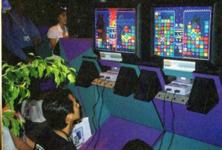
Trotz 32- und 64-Bit-Dominanz wurden die Super-NES-Neuheiten reichlich gespielt. Im Bild das vielversprechende "Tetris Attack".

Sieht man von der US-Veröffentlichung von Super Mario RPG ab, das parallel zur Messe ausgeliefert wurde und trotz einem Wahnsinnspreis von knapp 80 US-Dollar (20 Dollar teurer als „normale“ Nintendo-Module) binnen weniger Stunden vergriffen war, sonnte sich der