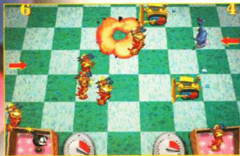
Philips unterstützt das Super NES mit dem Action/Strategie-Mix "Gearheads" (im Bild das PC-Original).

land erscheint, kommt „Super Mario RPG“ nicht bei uns auf den Markt (Square weigert sich, eine deutsche Version zu programmieren). Als Ersatz veröffentlicht Nintendo in Deutschland mit Enix' Terranigma (mit „Illusion of Time“ verschwägert) und Taito's Lufia 2 zwei neue Rollenspiele – und zwar noch dieses Jahr. Auch Tetris Attack steht in den SN-Startlöchern und könnte das zuletzt angeschlagene Renommee von „Tetris“-Clones aufpolieren: Die Charaktere aus „Yoshi's Island“ spielen in dem klassischen Zylinder-Outfit, haben aber neue Knobel-Tricks auf Lager.