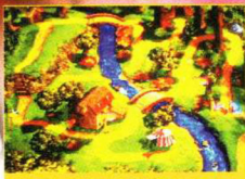
Ein idyllischer Bereich der neuen Oberwelt von "DK Country 3"

Kong-Clan im Rampenlicht. Die dritte Episode der Erfolgsserie knüpft spielerisch und optisch an die Vorgänger an und präsentiert auf 32 MBit faszinierende Render-Grafiken und komplett neue Spielwelten. Donkey Kong Country 3: Dixie's Double Trouble rückt Blondschoopf Dixie und ihren neuen Sidekick Kiddy Kong in den Mittelpunkt. Auf der Suche nach Diddy und Donkey Kong, die beide in den Versuchslaboren von Kaos gelandet sind, erlebt das Duo haarsträubende Abenteuer. Dabei kommen Kiddy's neue Fähigkeiten zur Geltung: So wird er beispielsweise von Dixie als rollendes Faß mißbraucht, auf dem die Dame elegant balanciert. Während „DK Country 3“ zu Weihnachten in Deutsch-