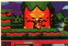
In Deutschland erscheint "Kirby Superstar" erst im Jahr 1997

re. Fortsetzungen erfolgreicher Serien dominierten, überraschende Neuentwicklungen gab's leider keine. Tatsache ist, daß die 16-Bit-er Ende 1996 endgültig abdanken, spätestens Weihnachten solltet Ihr dann eine Upgrade-Konsole im Visier haben.