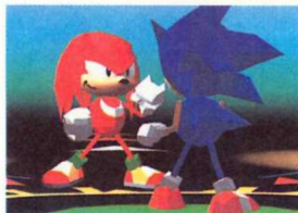
Virtua Fighter-Ableger zum zweiten: Im noch namenlosen Sonic Game machen drei Toons demnächst Jacky & Co Konkurrenz

...noch ein Prügelspiel aus dem Hause AM2. Diesmal dürfen sich Sonic, Knuckles, Tails und Konsorten im schicken Polygon-Design in bester Virtua Fighter-Manier gegenseitig auf die Knuddelnasen hauen. Das Spiel basiert auf der Model 2-Technik, über den Veröffentlichungstermin ist derzeit noch nichts bekannt.