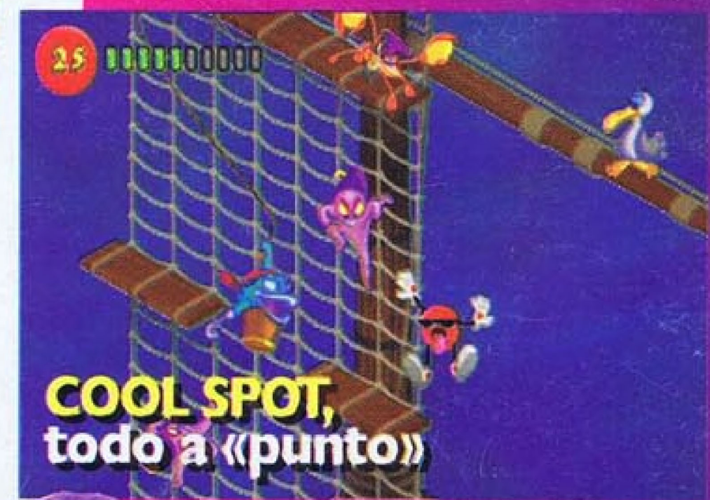
COOL SPOT, todo a «punto»