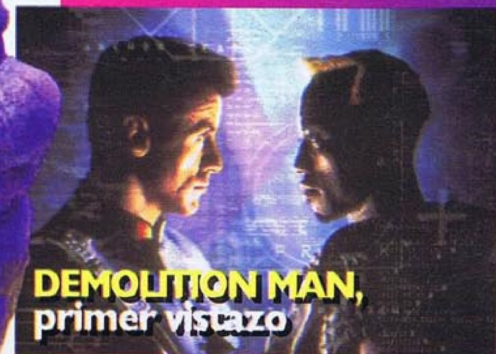
DEMOLITION MAN, primer vistazo