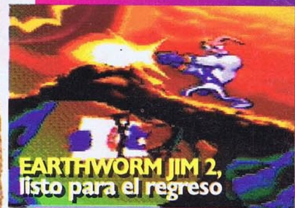
EARTHWORM JIM 2, listo para el regreso