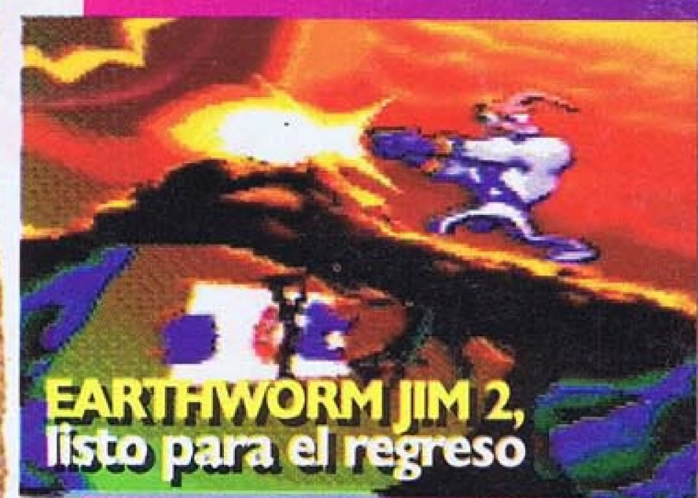
EARTHWORM JIM 2, listo para el regreso