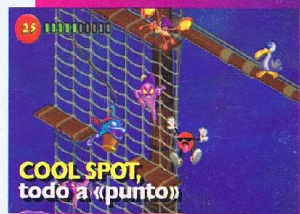
COOL SPOT, todo a «punto»