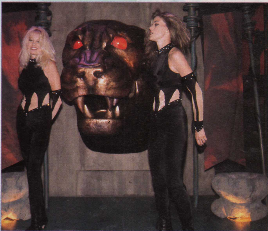
Killer Instinct, la star du stand Nintendo, focalisait toutes les attentions.

machine de rêve, conçue à base de processeur 64 bits, autour de 200 dollars (à peu près 1 000 francs). Le constructeur nippon a donc décidé d'attendre encore un peu, le temps nécessaire pour trouver les solutions lui permettant de produire en quantité industrielle, à moindre coût. En attendant, Nintendo