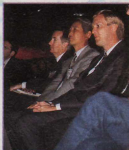
Les boss de Nintendo of America et de Silicon Graphics

compte, bien évidemment, vendre encore énormément de Super Nintendo et de Game Boy. Et il est vrai que Donkey Kong Country 2 et Killer Instinct, présentés sur Super Nintendo à E3, possèdent des qualités indéniables. De tels jeux devraient permettre au géant japonais de remplir tranquillement ses objectifs.