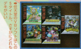
●任天堂のV-Bソフトはどれも5タイトル。さすがにどれも