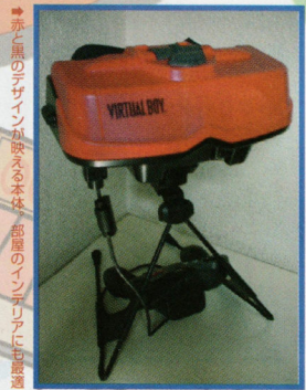
赤い面のボタンが特徴的な本体。画面のインポートは液晶

結局発売されたのはわずか19タイトルのみ。当初は通信ケーブルで2台のバーチャルボーイを接続しての、対戦ゲームも予定されていたが、通信対応ソフト・通信ケーブルともに発売されないまま、静かに商品寿命を終えてしまった。先月紹介した「サテラビュー」と同様、商業的には失敗してしまっただけで、クリアな立体映像、本体左右に設けられたスピーカーによるステレオサウンド、洗練されたコントローラなど、ハードウェアとして評価すべき点は多い。ただ、登場した時代があまりにも早すぎた。