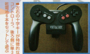
●左右の十字キーが特徴的なコントローラ。後ろ側には乾電池も水をセメントして遊ぶ