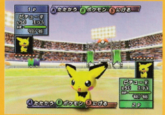
©1995-2000Nintendo /Creatures inc./GAME FREAK inc.