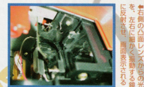
●赤い面のボタンが特徴的な本体。画面のインポートは液晶