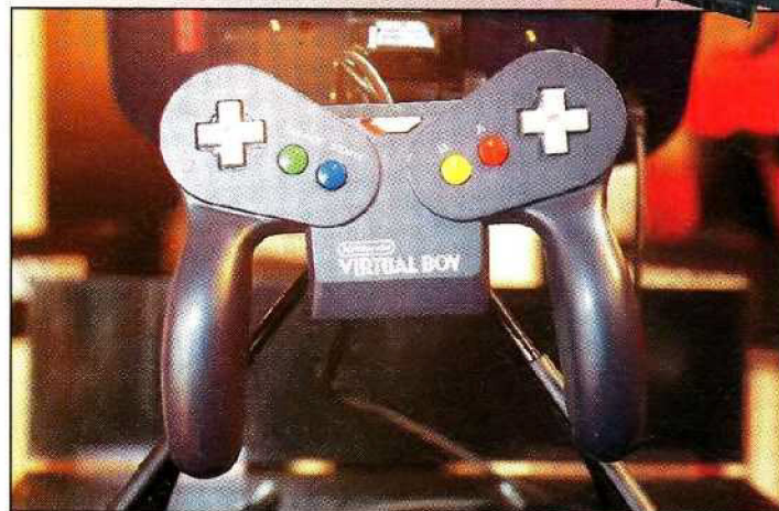
Witziges Pad mit zwei Steuerkreuzen und vier Buttons. Genial: die schweren Batterien geben dem Pad das nötige Gewicht