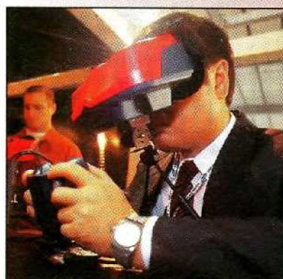
Nicht für unterwegs? Doch: Ein Tragegurt für den VB ist geplant!