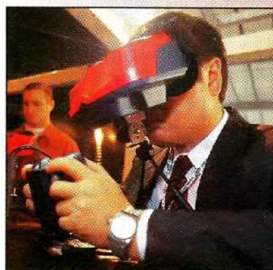
Nicht für unterwegs? Doch: Ein Tragegurt für den VB ist geplant!

Witziges Pad mit zwei Steuerkreuzen und vier Buttons. Genial: die schweren Batterien geben dem Pad das nötige Gewicht