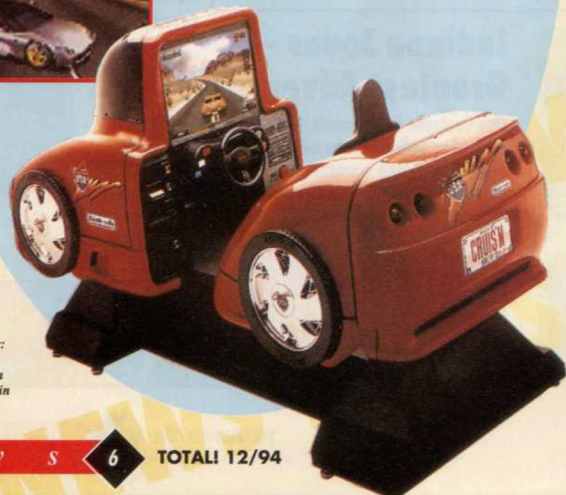
Schnittiger Flitzer: „Cruis'n USA“ kommt zum Teil in Edel-Ausstattung in die Spielhallen!