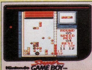
Die Klassiker Donkey Kong und Tetris kommen im Juli für den Super Game Boy in Farbe!